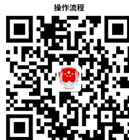
11.公职律师工作证颁发

http://zwfw.hld.gov.cn/hldzwdt/epointzwmhwz/pages/eventdetail/personaleventdetail?taskguid=a13ee3ce-3974-46b7-af32-e2eeb4aea784