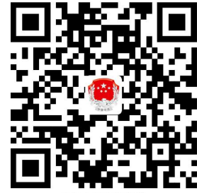
容缺办理事项清单