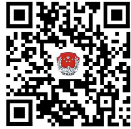
司法局权力事项清单